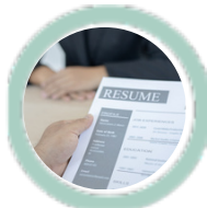
Adil iş uygulamaları