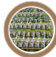
Aidiyet ve kişisel gelişim