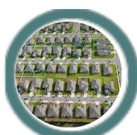
Leitung der Organisation