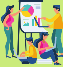
İklim Değişikliği Analisti