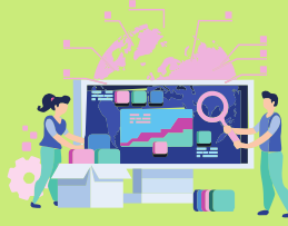
Doğa Koruma Uzmanı