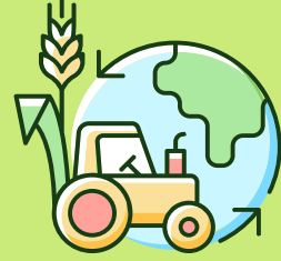
Sürdürülebilir Tarım Uzmanı