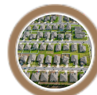
Inclusión y desarrollo