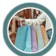
Protección del consumidor